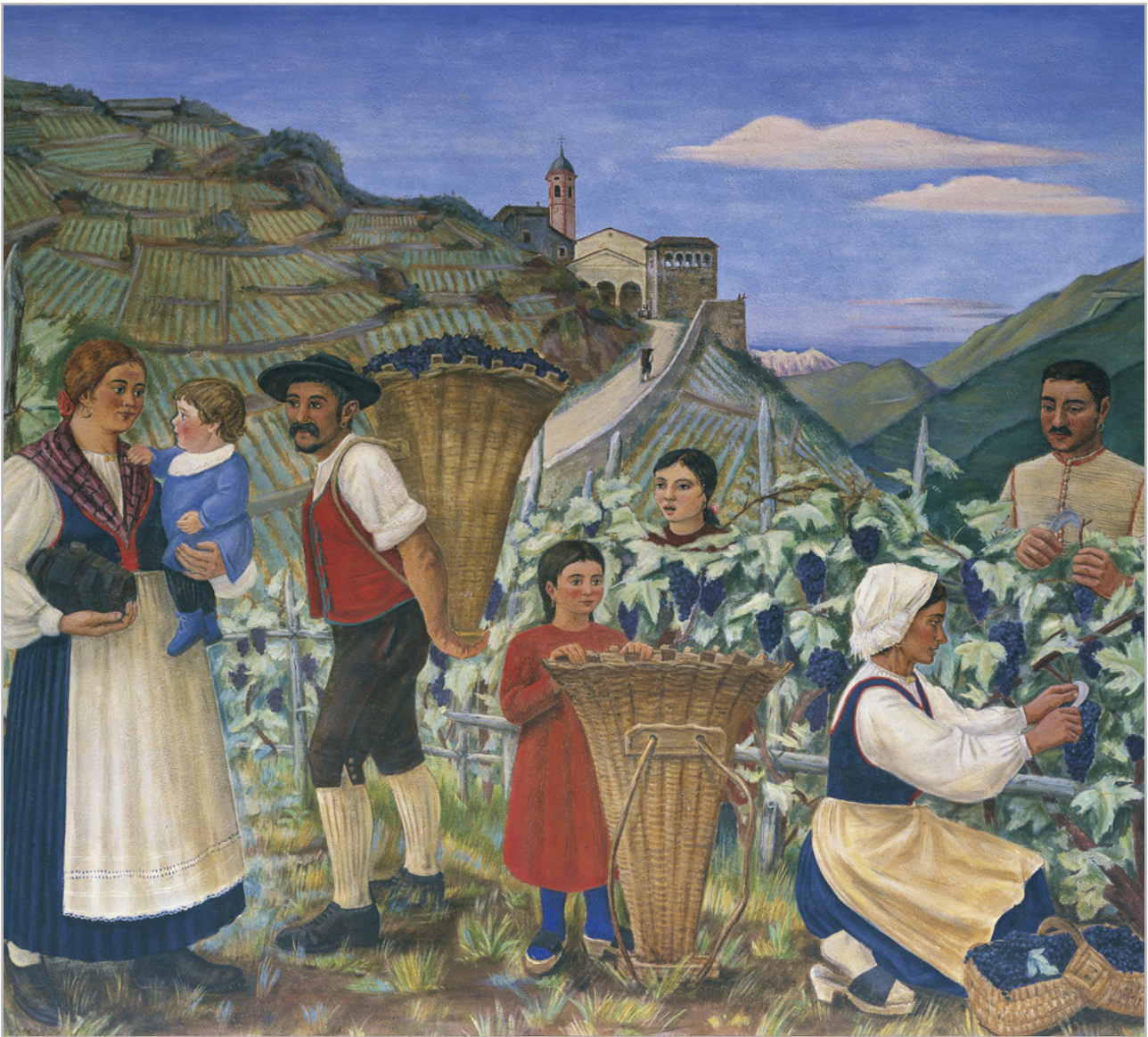
Gianfilippo Usellini, La vendemmia , Palazzo del Governo, sala consiliare